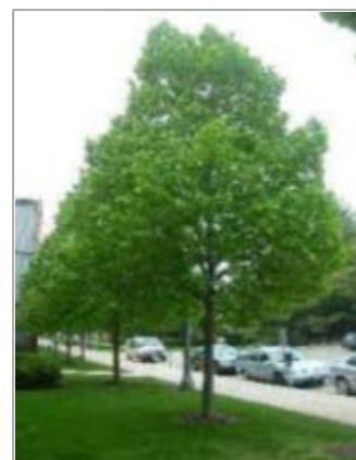
Linde: Tilia europaea 'Erecta'

Ook legt de gemeente een zebraapad aan ter hoogte van huisnummer 617.