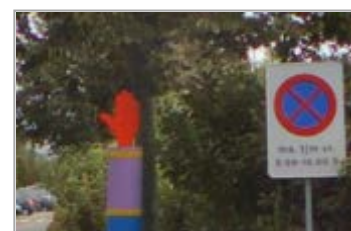
Stopverbod in een schoolzone

Door de hoeveelheid auto's die in de ochtend en in de middag naar de schoolzone komen en het aantal beschikbare parkeerplekken, in de directe omgeving, zetten de ouders hun auto geregeld langs de rondweg. Dit veroorzaakt een onveilige en chaotische situatie.